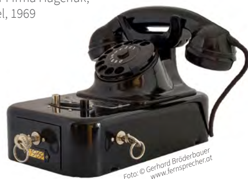
Tisch-Münzfernsprecher der Firma Hagenuk, Kiel, 1969